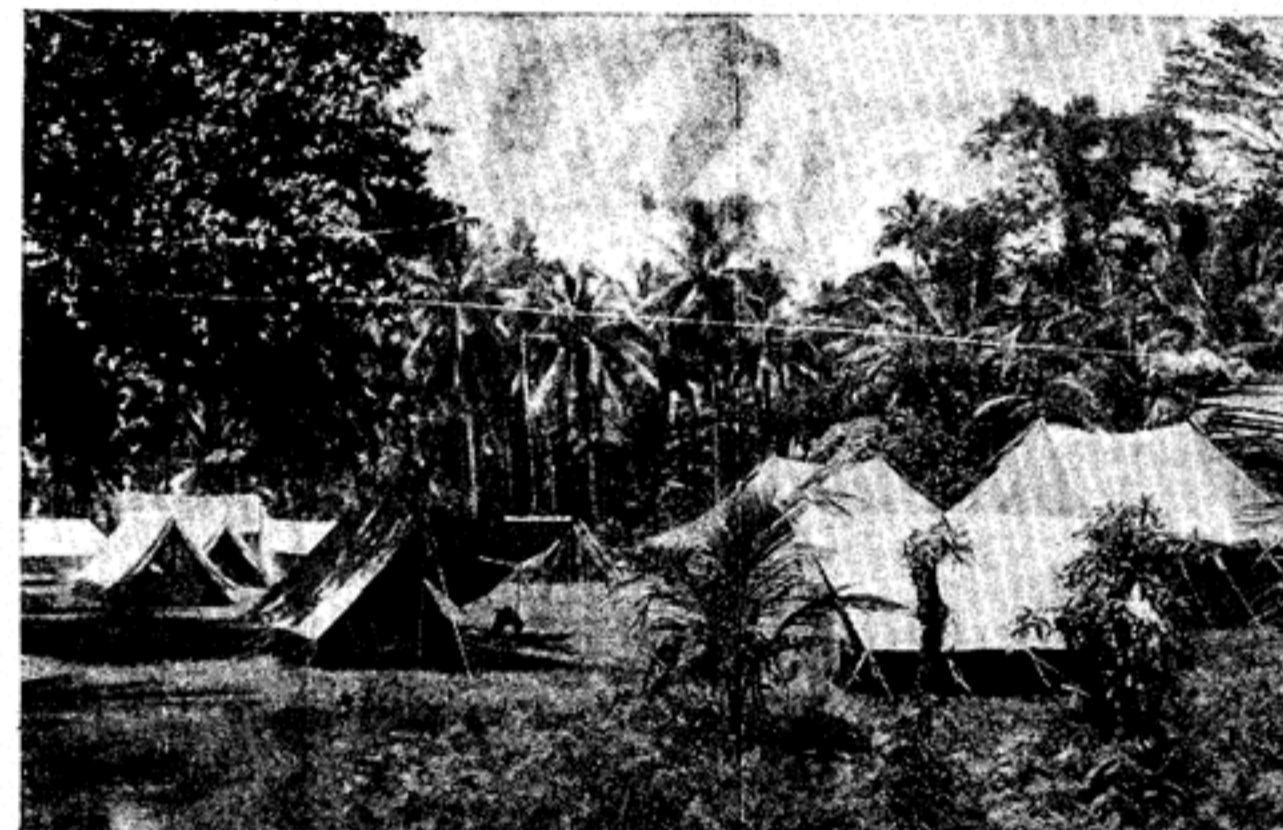
(Van een bijzondere medewerker)

TEGEN het decor van hoge klapperbomen straalt het basiskamp, dat wij betreden, een rust uit die alleen wordt verstoord door het geluid van de ver verwijderde branding en het gekrijs van onzichtbare vogels in het oerwoud. Niets wijst er aanvankelijk op dat in dit kamp, dat gelegen is op het dichtbegroeide eiland Soepiori ten westen van Biak, een grote activiteit heerst.