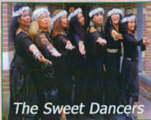
The Sweet Dancers